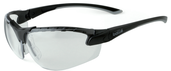
ガスケットなしイメージ