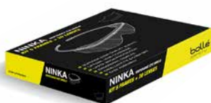
PSONINS010 Kit Mini