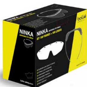
PSONINK010 Kit Groot