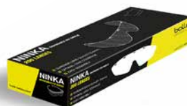
PSLNINKP01 Losse lenzen 200 lenzen