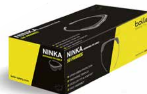
PSPNINKQ01 Losse frames 50 monturen