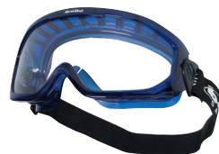
Adaptable on all BLAST models

Ce département de Bollé Safety offre un système simple et flexible, basé sur une tarification unique . La gamme se compose de montures variées sur lesquelles peuvent s'adapter 3 types de verres correcteurs (unifocaux, bifocaux, progressifs) en 3 matières différentes (polycarbonate, CR39 ou verre minéral).